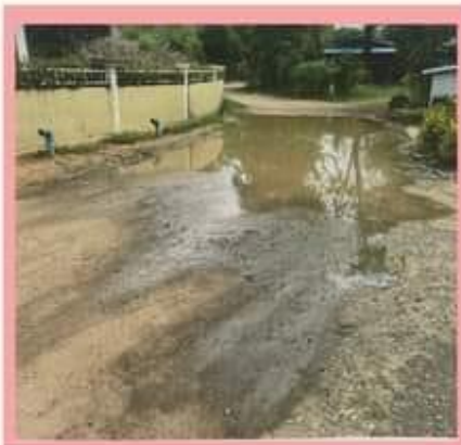
ภาพถ่ายหลังดำเนินการเสร็จสิ้น