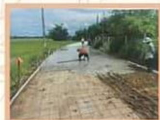
ภาพ / ข่าว ที่งานประชาสัมพันธ์ ทต.ทุ่งทอง อ.บ้านเขว้า จ.ชัยภูมิ