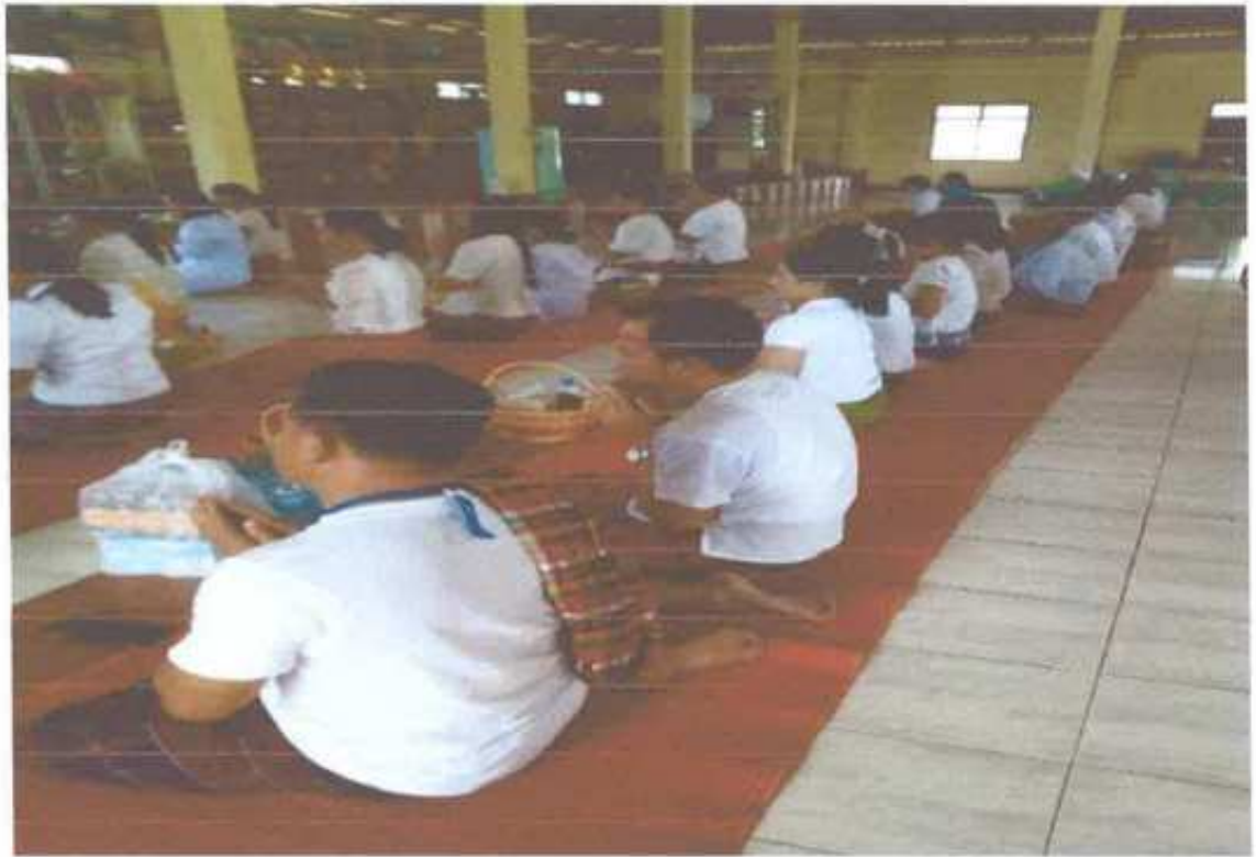
ครู ศพด. วัดสายตะคลองนำเด็กเข้าร่วมทำบุญวันพระ

ภาพถ่าย โครงการทำบุญวันธรรมสวนะ(วันพระ) ประจำปี ๒๕๖๓ ครั้งที่ ๓ วันอังคารที่ ๔ สิงหาคม ๒๕๖๓ ขึ้น ๑๕ ค่ำ เดือน ๘ ณ สำนักสงฆ์บ้านกุดไข่มุน บ้านกุดไข่มุน หมู่ ๘ ตำบลบ้านเขว้า อ.บ้านเขว้า จ.ชัยภูมิ